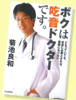
「吃音ドクター」で話題!!

中学1年生の時に、「吃音の悩みから救われるためには、医者になるしかない」と思い、猛勉強の末、鹿児島ラ・サール高校卒業後、1999年九州大学医学部に入学。医師となり、研修医を2年間終えた後、2007年に九州大学耳鼻咽喉科に入局。2008年より九州大学大学院に進学し臨床神経生理学教室で、「脳磁図」を用いた吃音者の脳研究を行い、今まで4度国内外での受賞をしている。現在、九州大学病院耳鼻咽喉科で吃音外来を担当。吃音の著書は8冊出版し、全国各地で吃音講演会をしている。医師の立場で吃音の臨床、教育、研究を精力的に行っている吃音の第一人者である。